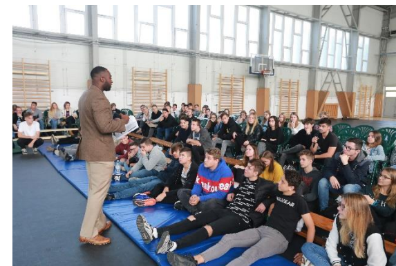
Amerika nap a Katedrában